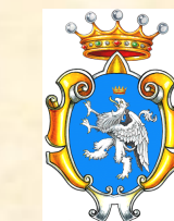
Comune di Diano Marina