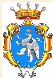
Comune di Diano Marina

Il Concerto è stato realizzato in collaborazione con: